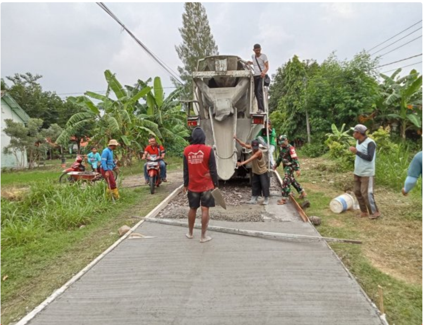
Membangun Desa Bersama Warga, Prajurit Kodim 0804/Magetan Tingkatkan Kemanunggalan Dengan Rakyat

Magetan. - Selalu dekat dengan rakyat dan selalu dihati rakyat, merupakan salah satu kunci utama keberhasilan TNI AD yang menganut sistem ketahanan rakyat semesta yang mana dengan kebersamaan antara TNI dan rakyat itu akan