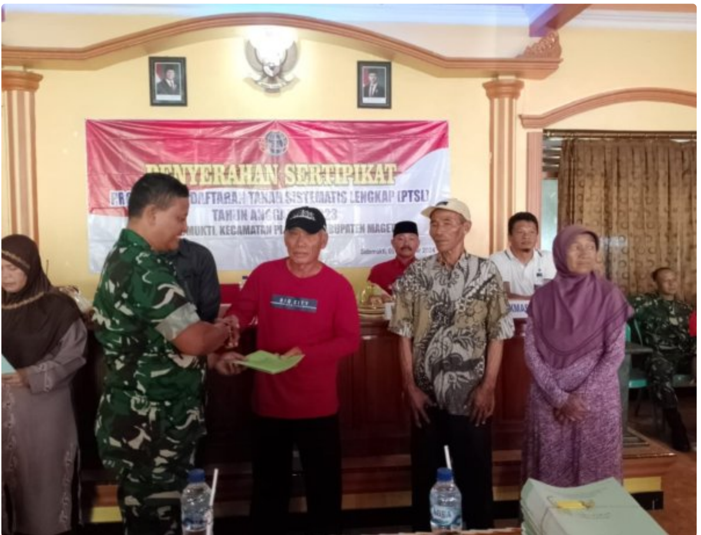
Danramil 0804/02 Plaosan Hadiri Penyerahan Sertifikat Program Pendaftaran Tanah Sistematis Lengkap (PTSL) Desa Sidomukti

PLAOSAN. - Desa Sidomukti melalui Badan Pertanahan Nasional (BPN) melakukan penyerahan Sertifikat Tanah Program Pendaftaran Tanah Sistematis